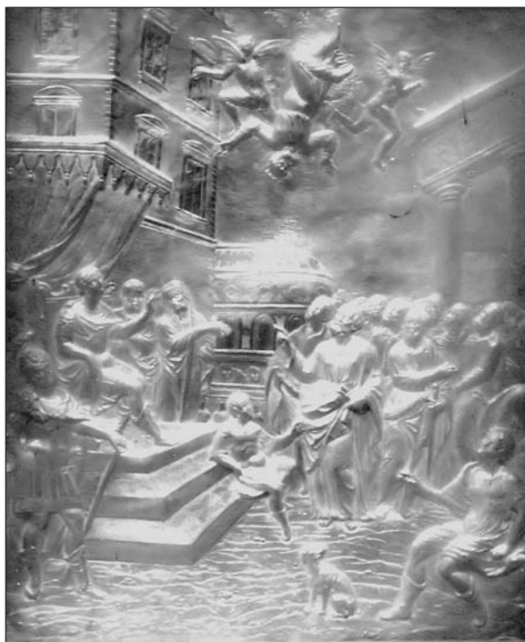
La caída de Simón el Mago Relieve sobre chapa de plata, de la primera mitad del siglo XVII Parroquia de la Asunción de Nuestra Señora. Briones

- Acontecimientos mundiales: Vais a oír estruendo de batallas y noticias de guerra. No os alarméis, eso tiene que ocurrir 10 . La buena noticia del Reino se proclamará en el mundo entero, para que llegue a todos los pueblos 11 .