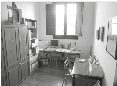
Vista de la Sede desde su interior

Para ello, os invitamos, apreciables devotos, a que os encomendéis a él en todas vuestras necesidades y las de vuestras familias.