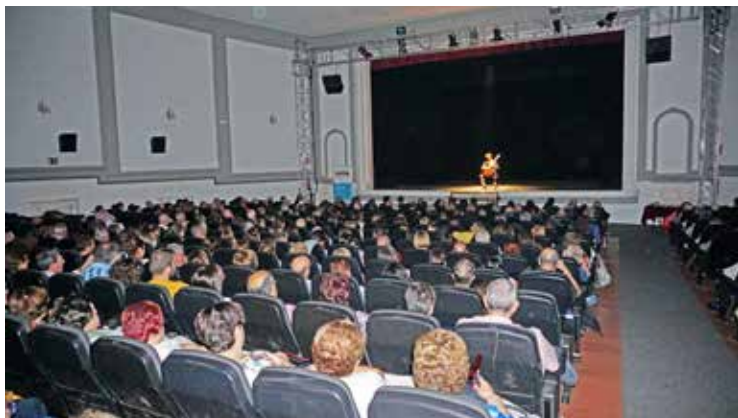
Concierto Pablo Sainz Villegas.