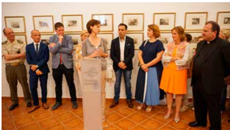
Inauguración grabados de Goya