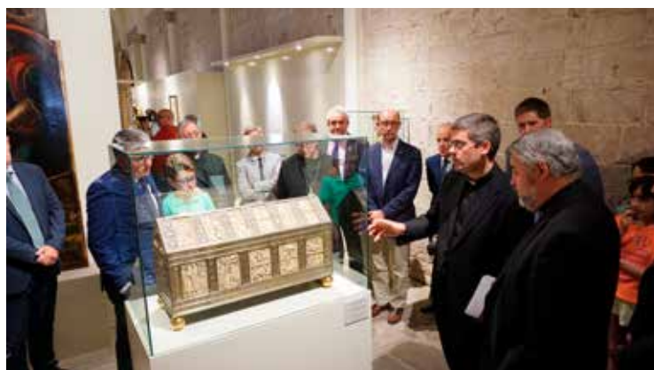
Inauguración Expo Dominicus