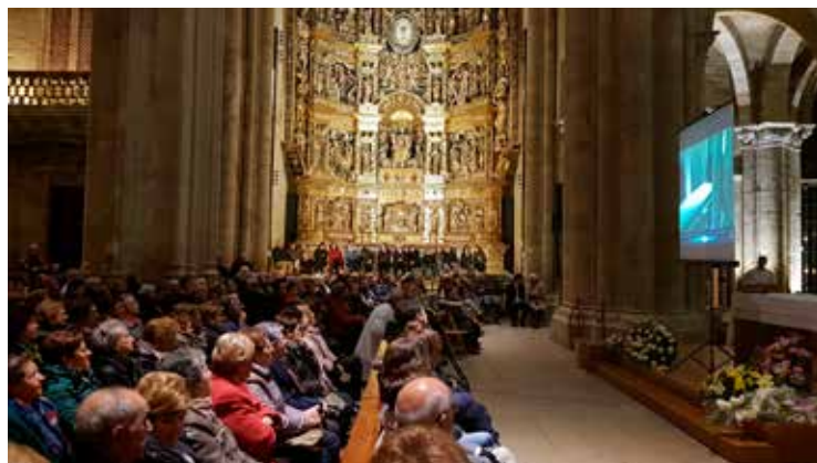
Presentación Restos del Santo