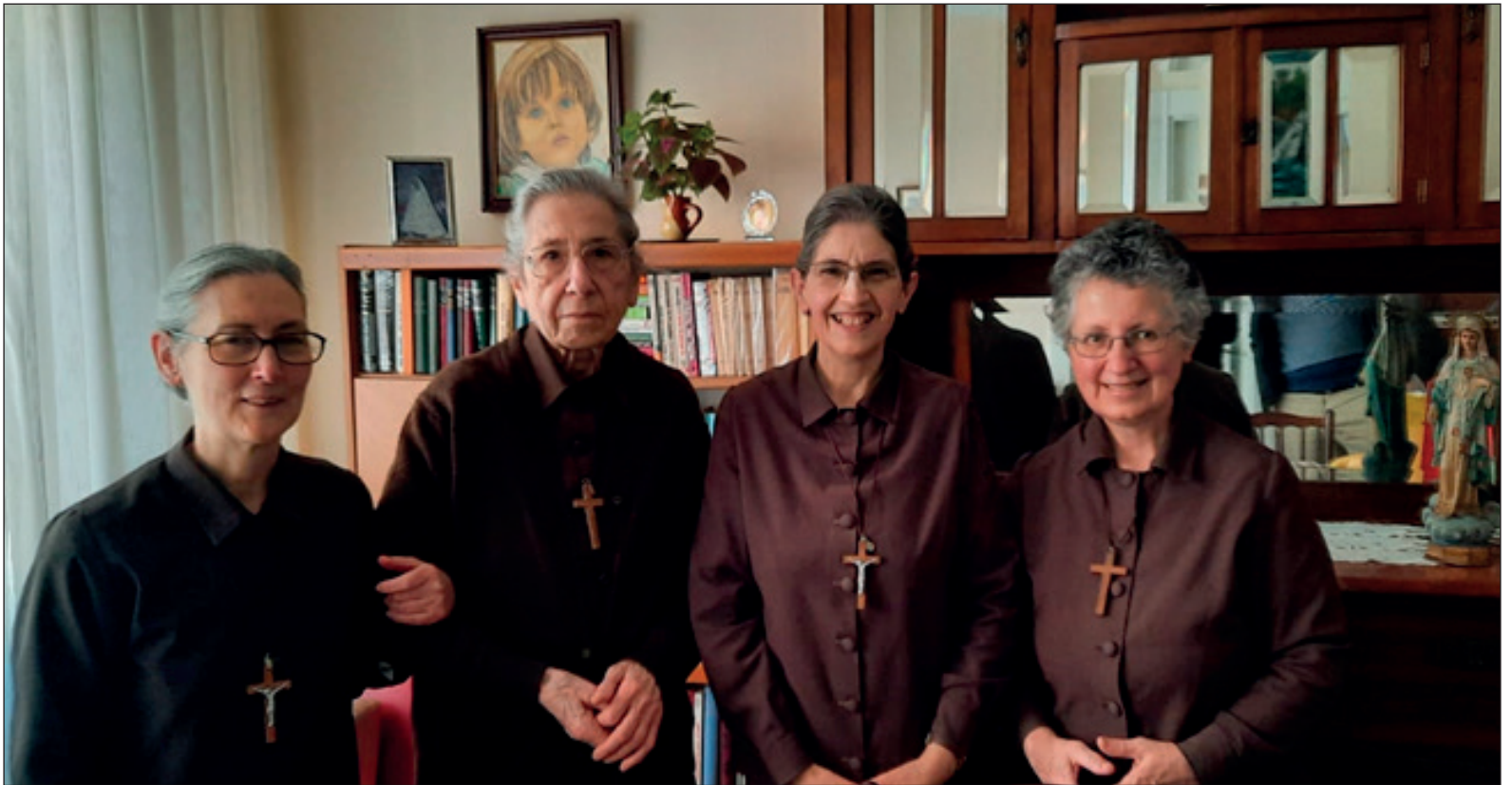
Actual comunidad de las hermanas FRANCISCANAS DE JESÚS.

Las Hermanas Franciscanas de Jesús forman una fraternidad de "Derecho Diocesano".