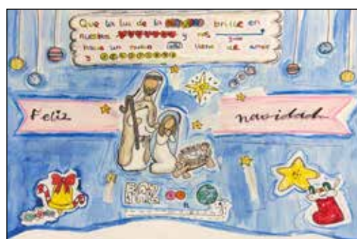
Noa Orio Puelles Bretón de los Herreros