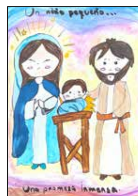
Valeria Quilez San Pío X