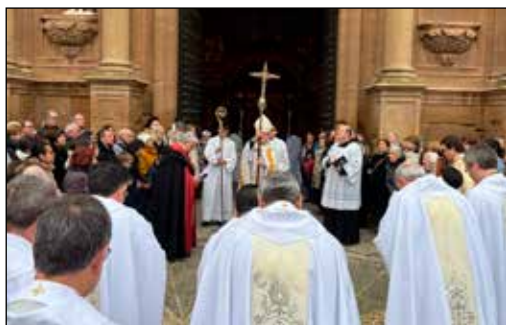
“UN NUEVO TIEMPO”