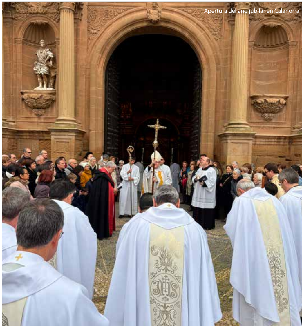
Apertura del año jubilar en Calahorra

La exclamación ¡Ven Señor Jesús!, llena de esperanza, que brota de la fe, y que mueve a la caridad, la hemos querido sembrar dentro y fuera de nuestra diócesis con los distintos encuentros jubilares, donde hemos recibido la gracia de la indulgencia de este tiempo, el deseo de la conversión, el compromiso económico concreto en la lucha de la trata de personas, nuestro plan de vivienda diocesano en sintonía con la ayuda de Cáritas, el recuerdo agradecido del 1700 aniversario del Credo de Nicea, los encuentros con los distintos agentes sociales, el cuidado y exposición del patrimonio cultural, el llamamiento a reconocer y vivir de